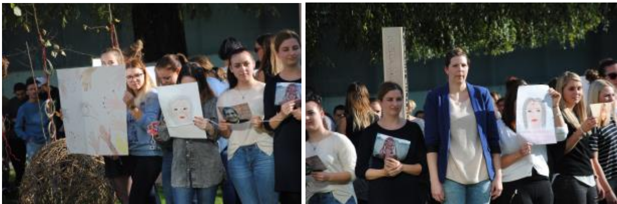
Drucken im Druckwerk, BRG-Borg Dornbirn Schoren, April 2017

Im Rahmen des Projektes bildeten je eine Berufsschule sowie eine Kultureinrichtung bzw. eine Kulturschaffende, ein Kulturschaffender eine Kooperation. Die Lehrlinge sollten dabei so weit wie möglich in die einzelnen Projektabschnitte eingebunden sein und so Erfahrungen in künstlerischen Bereichen aber auch in Zusammenhang mit Projektarbeit machen können.