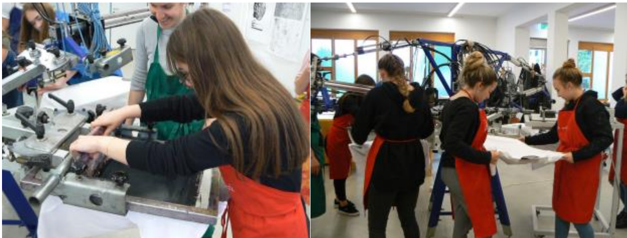
Drucken im Druckwerk, BRG-Borg Dornbirn Schoren, April 2017

Gefördert werden Kulturprojekte, die sich innovativer Methoden der Kunst- und Kulturvermittlung bedienen: SchülerInnen, LehrerInnen und KünstlerInnen erarbeiten gemeinsam ein Kulturprojekt und erleben miteinander einen kreativen Schaffensprozess.