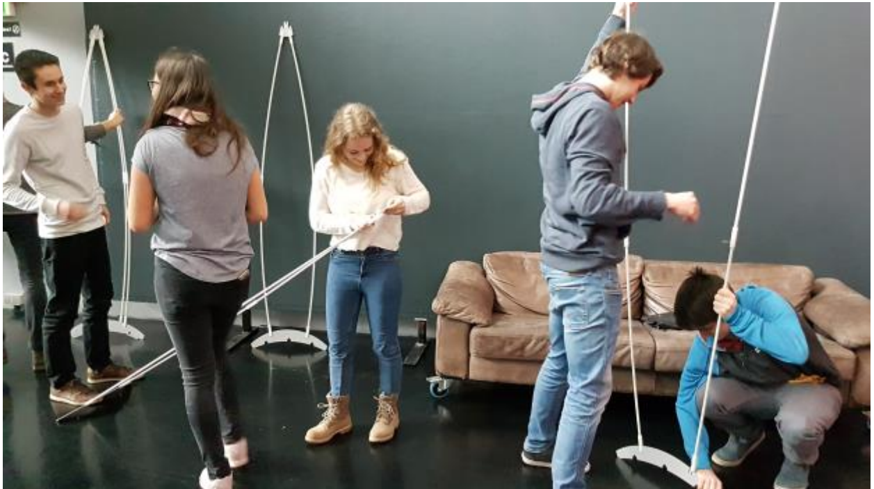
Schultour Anne Frank Ausstellung – Gymnasium Schillerstraße, Feldkirch, Juni 2017